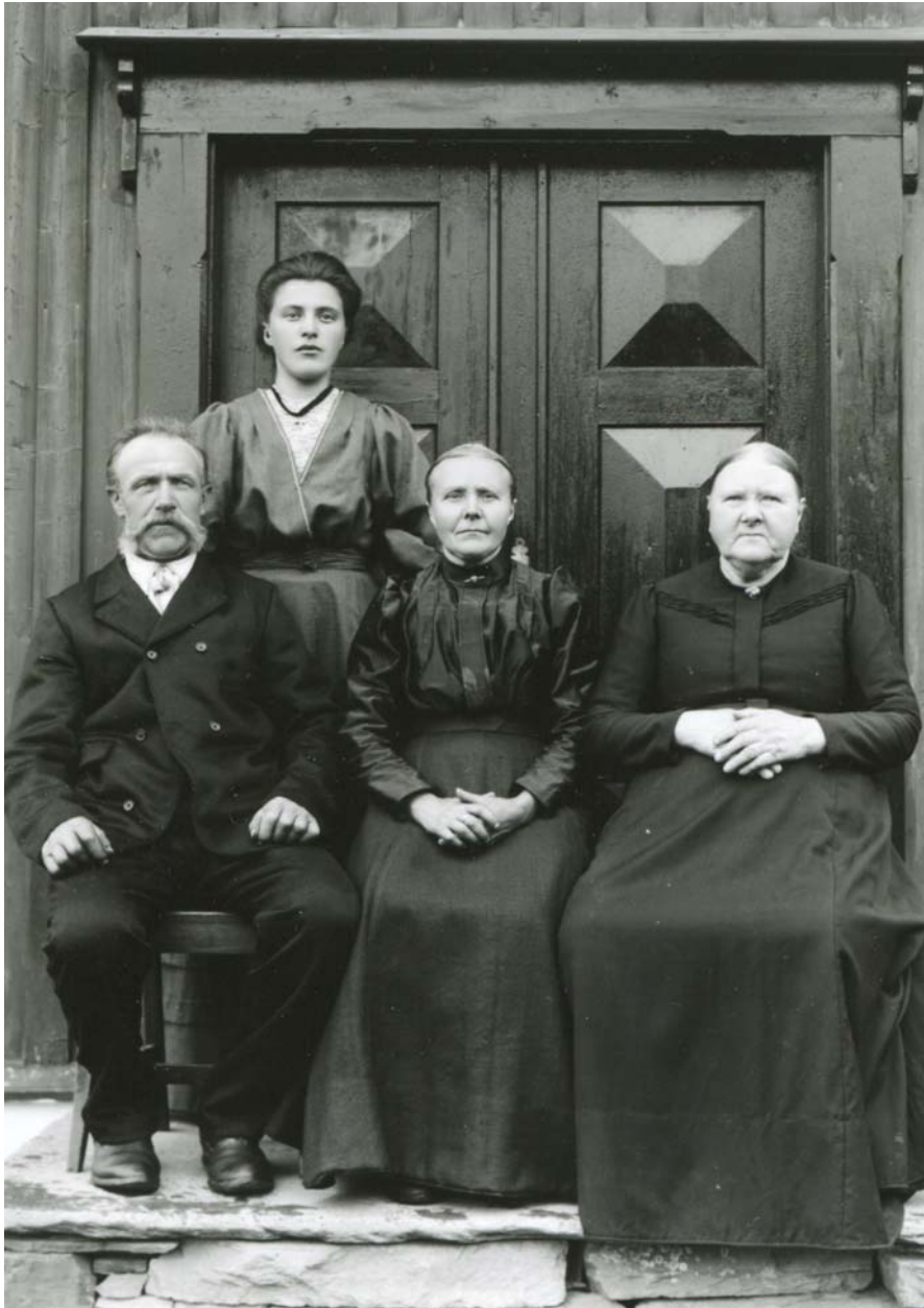
3 generasjoner Sorte i 1908