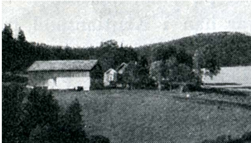
Østerli Gnr. 151 br. 3